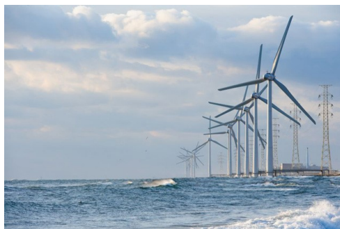
ウィンドパワーかみす洋上風力

洋上風力発電には、着床式と浮体式の二通りの方式がある。世界的には着床式が多い。NEDOが進める着床式洋上風力発電としては、銚子沖2,460kWと北九州沖1,980kWがある。