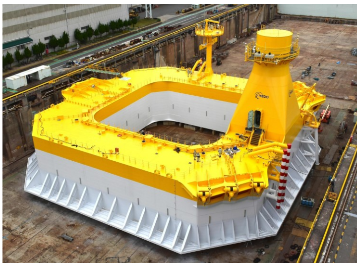
浮体式風力発電

日本の場合、周辺海域の水深が深く、海底の地形も複雑なため、浮体式が有望と見られている。水深が50mを越えると着床式でコストアップになる。浮体式洋上風力発電として、福島沖合約20kmの2,000kW、5,000kW、7,000kWがある。